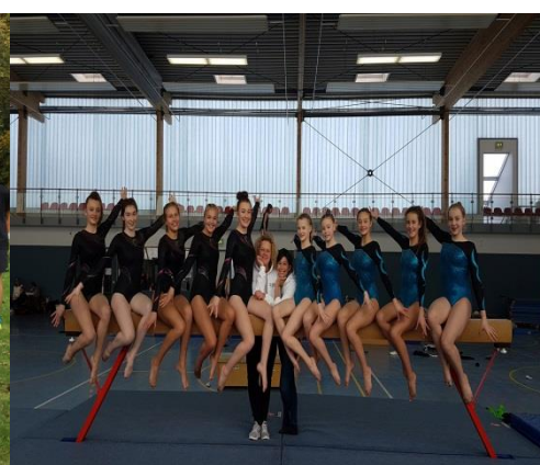
Gerättturnen – Siegerinnen bei JTFO