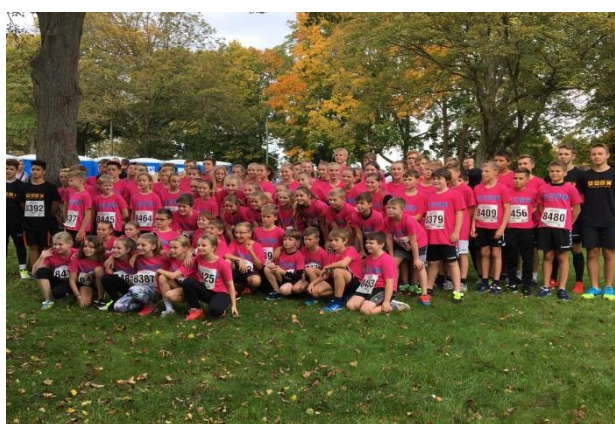
Mini-Marathon 1. Platz im Jahrgang 2004/2005