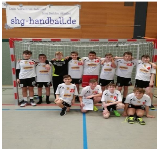
Sieger Regionalscheid Handball WK III