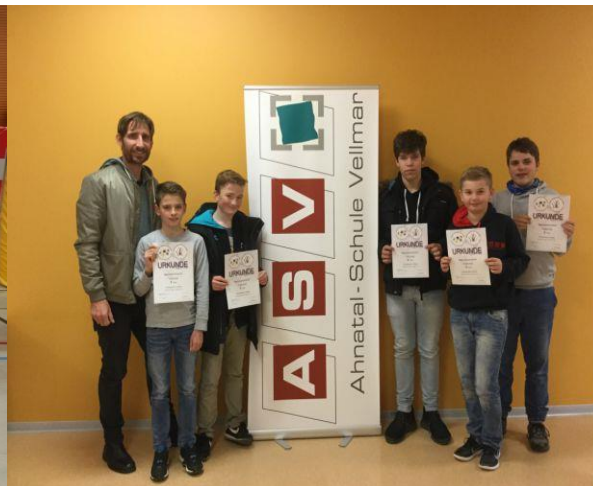
2. Sieger Regionalscheid Volleyball