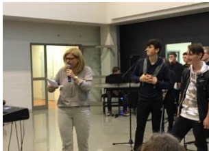
Preisverleihung Frau Jama